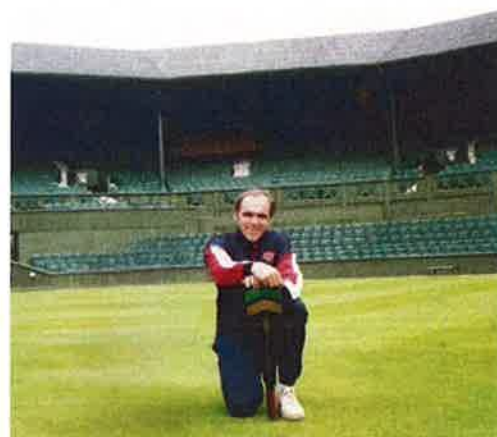
Wimbledon Centre Court, 1986